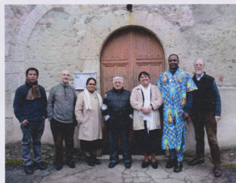
MSC et Filles de N.D. du S.C. présents à la Ferté St Aubin

Marie chemin de beauté P. Alfred BOUR, msc 11-16 août 2015, Issoudun Contact : issoudun@wanadoo.fr (33) 02 54 03 33 83