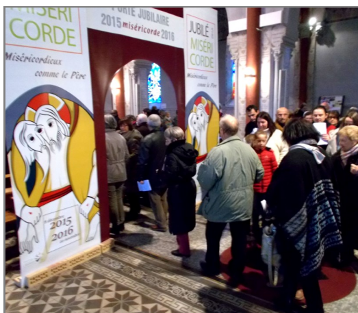
Passage de la porte jubilaire lors de la célébration du 13 décembre, jour de l'ouverture de la porte sainte.