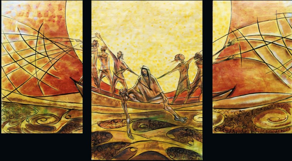
Fresque missionnaire réalisée par le Fr Anderson, MSC du Brésil, à l'occasion du Chapitre Général des Missionnaires du Sacré-Cœur à Madrid, Espagne.