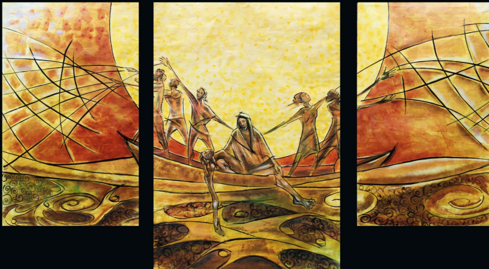
Fresque missionnaire réalisée par le Fr Anderson, MSC du Brésil, à l'occasion du Chapitre Général des Missionnaires du Sacré-Cœur à Madrid, Espagne.

Nous sommes animés nous aussi par le don de l'Esprit qu'a reçu notre Fondateur. Nous vivons en communion fraternelle notre foi en l'amour miséricordieux du Seigneur ; en même temps, nous sommes envoyés dans le monde pour proclamer la Bonne Nouvelle et de la tendresse de Dieu notre Sauveur et pour en être témoins par toute notre vie. [Livre de vie MSC n°4]