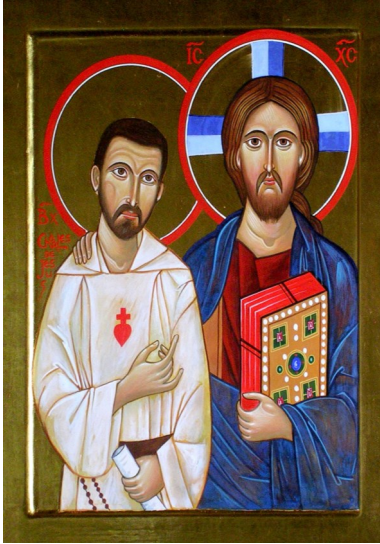
icône de la chapelle des Herbiers (Vendée) Frère Charles compagnon de Jésus.

Mon Père, Je m'abandonne à toi, fais de moi ce qu'il te plaira. Quoi que tu fasses de moi, je te remercie. Je suis prêt à tout, j'accepte tout. Pourvu que ta volonté se fasse en moi, en toutes tes créatures, je ne désire rien d'autre, mon Dieu. Je remets mon âme entre tes mains. Je te la donne, mon Dieu, avec tout l'amour de mon cœur, parce que je t'aime, et que ce m'est un besoin d'amour de me donner, de me remettre entre tes mains, sans mesure, avec une infinie confiance, car tu es mon Père.