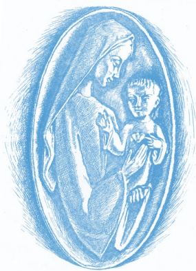
« Mère du Bel Amour » expression chère à St Jean-Paul II (Cf. Annales d'avril 2015)

Tu es la femme radieuse du matin de Pâques tu as cru au Dieu de l'impossible qui renverse les puissants et élève les humbles et qui fait miséricorde d'âge en âge, dans les siècles des siècles. Amen.