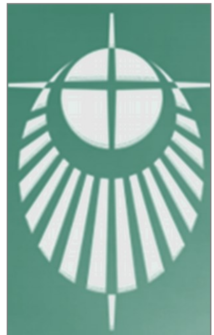
Logo du sanctuaire de la Divine Miséricorde à Cracovie