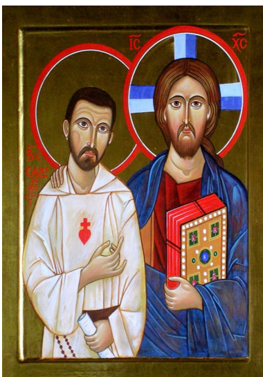
icône de la chapelle des Herbiers (Vendée) Frère Charles compagnon de Jésus.

Mon Père, Je m'abandonne à toi, fais de moi ce qu'il te plaira. Quoi que tu fasses de moi, je te remercie. Je suis prêt à tout, j'accepte tout. Pourvu que ta volonté se fasse en moi, en toutes tes créatures, je ne désire rien d'autre, mon Dieu. Je remets mon âme entre tes mains. Je te la donne, mon Dieu, avec tout l'amour de mon cœur, parce que je t'aime, et que ce m'est un besoin d'amour de me donner, de me remettre entre tes mains, sans mesure, avec une infinie confiance, car tu es mon Père.