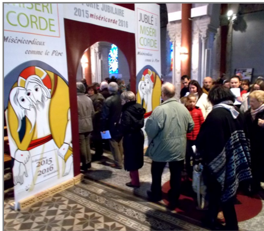
Passage de la porte jubilaire lors de la célébration du 13 décembre, jour de l'ouverture de la porte sainte.